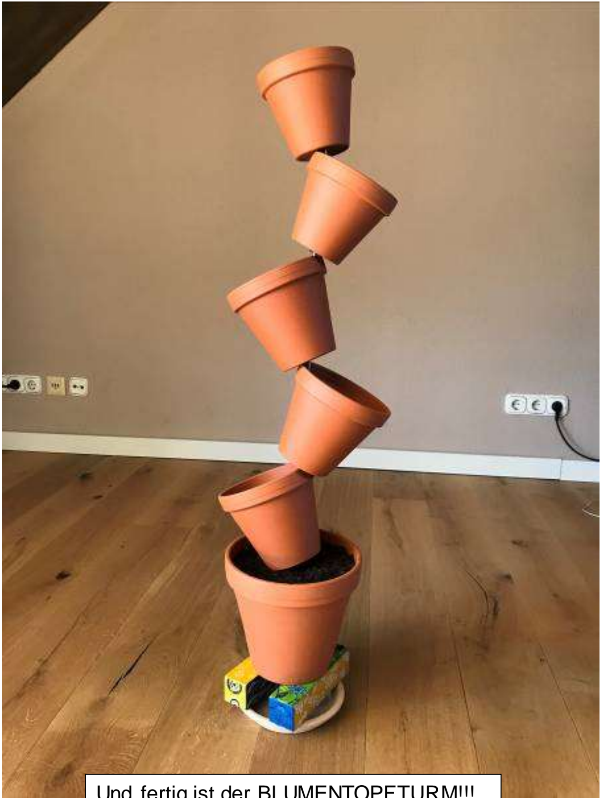
Und fertig ist der BLUMENTOPFTURM!!!